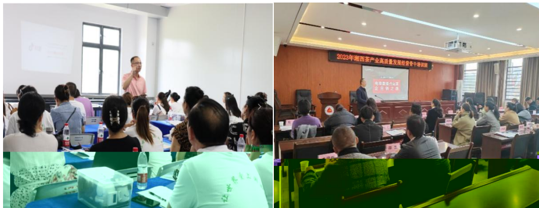
图 企业协助学校为湘西茶企开展电商直播培训

更 对 电 的 。 过 的 ， 茶 得 更 地 电 播的操 、 策 等方 的 ， 电 的 奠定 础。