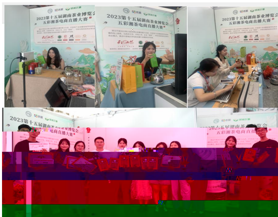
图 “湖南省第十五届茶博会” 电商直播比赛现场

播 和 方 的 ， 短 得 的 步。 队 比 ， 10 多 单 、 单 ， 包 但 不 ， 等 多 个 ， 的 和 队 得 的 高 度 。 的 得 不 对 公 的 ， 更 对 参 付 出 和 的 充 分 定。