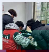
同学们在线下门店实训场景