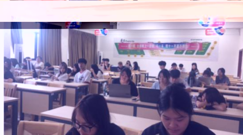
中国实训项目实训场景